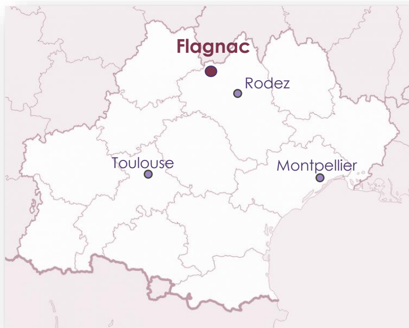
Flagnac – Département de l'Aveyron et Région Occitanie